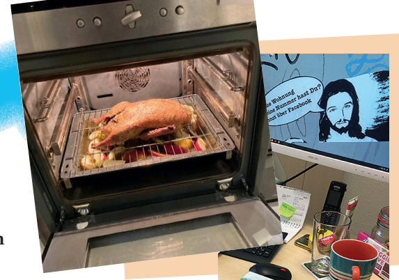
Öffne deinen Ofen ...

Im Café Augenblicke setzen wir eine verlässliche Beständigkeit dagegen. Wir sind da. Unsere Türen sind offen. Für alle. Ob Weihnachten, zwischen den Jahren, Neujahr, bei Sturm, klirrender Kälte, Dauerregen oder Sonne. Sei willkommen, wärm dich auf, iss und trink etwas, sei sicher in der Gemeinschaft. Und wenn es nur für 30 Minuten ist. Unsere Senioren*innen des Klönschnack 60plus Angebots haben wir mit Beginn des Jahres zunächst wieder mittels Postkontakt „versorgt“. Ab März hoffen wir uns auch mit ihnen wieder im Café treffen zu können. Dann machen wir uns gemeinsam auf den Fastenweg 2022. Wir wandeln mit dem Fastenwegweiser des Andere Zeiten e.V.. Vielleicht wandeln wir uns oder unseren Blick auch ein wenig. Vielleicht können Glaube und Hoffnung stark und mutig werden. Wir sind gespannt! Übrigens: total stark war auch, dass wir zu Weihnachten erfahren durften, wie Liebe zuerst durch den Ofen und danach durch den Magen geht. Etliche Menschen haben ihr Herzen und Öfen geöffnet und uns Weihnachtsenten zubereitet – da wurde Liebe „schmeckbar“. Den neuen Ofen und Herd in unserer Küche, den es zum Neujahrsstart gab, bedienen wir aktuell in einem großartigen und kreativen Teamwork. Unser Koch Samuel ist krankheitsbedingt ausgefallen, so dass auch hier neue Ideen und Veränderung gefordert sind. Dabei zeigen sich wahrlich die „Perlen“ unseres Arbeiterteams und auch, dass es sehr wohl geht: im Glauben zu wandeln und nicht im Schauen.