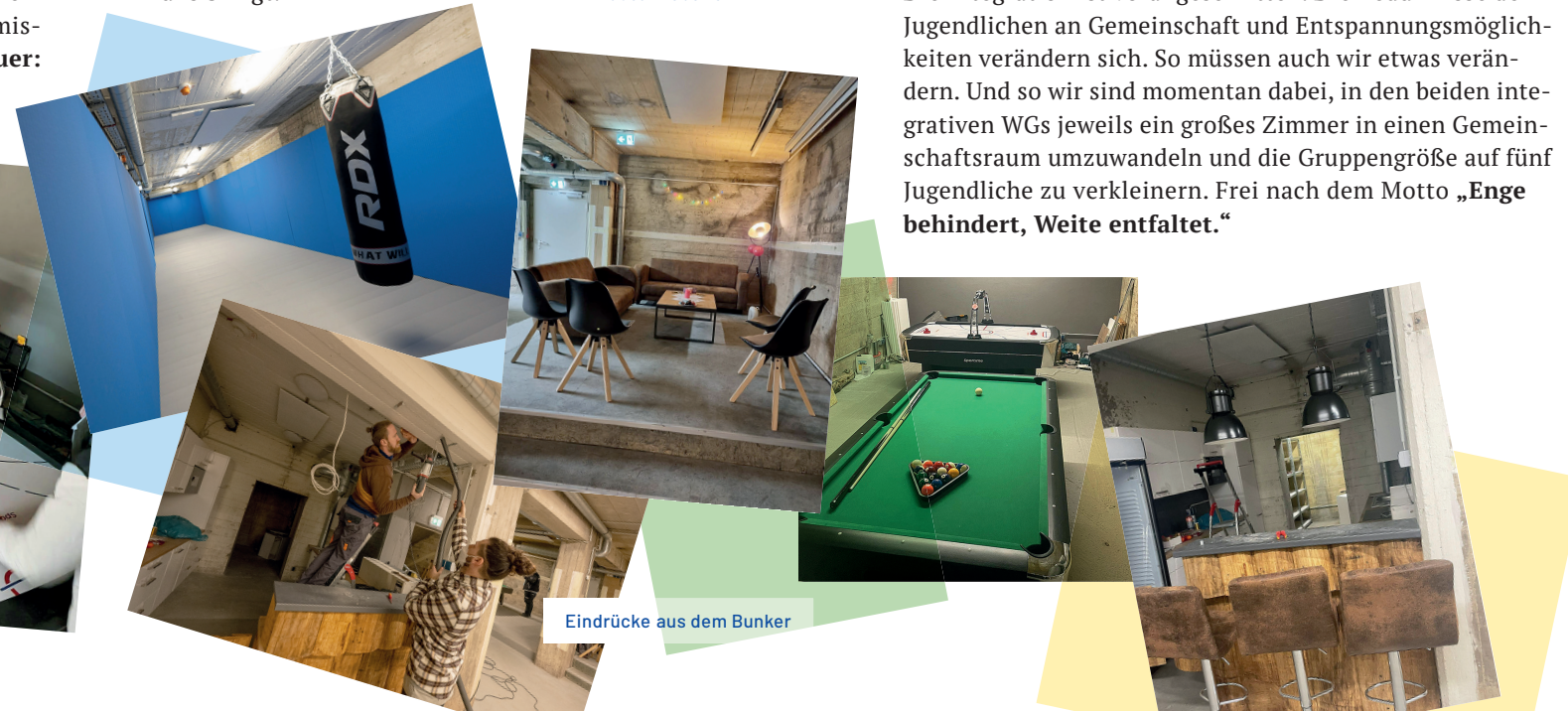
Eindrücke aus dem Bunker